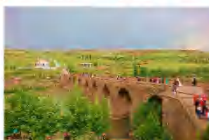
สะพานสิบโค้ง