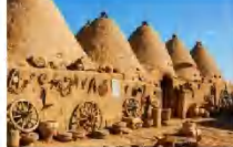
บ้านแบบรวงผึ้ง