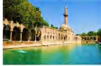
ถ้ำอับราฮัม