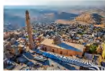
เมืองมาร์ดิน