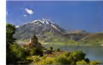
เมืองวาน