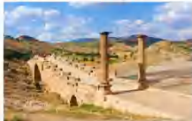
สะพานเซเวอร์ริน