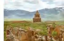
เมืองแอนิซม