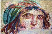
พิพิธภัณฑสถานแห่งชาติซูมา โมเสก