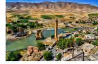
เมืองฮาซันคีฟ