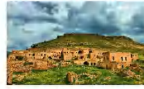
เมืองดารา