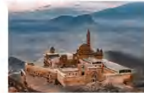
พระราชวังอิซฮาก พาชาร์