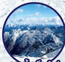
ธารน้ำแข็งต้ากู่