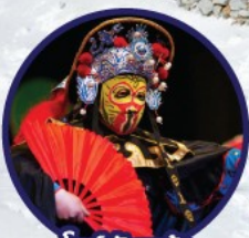
โชว์พื้นหน้า