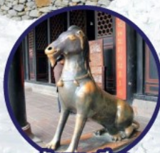
วังแพะเขี้ยว