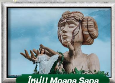
ใหม่!! Moana Sapa