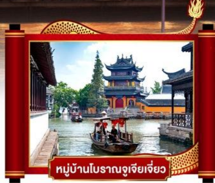
หมู่บ้านโบราณจูเจียเจี๋ย