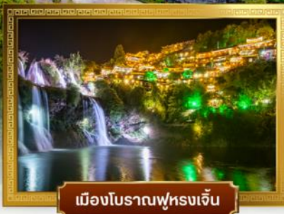
เมืองโบราณฟุหรงเจิน