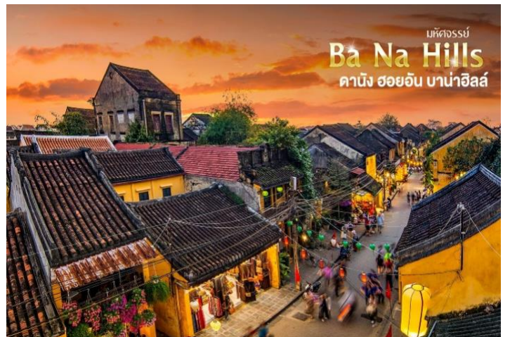
บริษัทจอสซี่ Ba Na Hills คาบัง ฮอยอัน บานาฮิลล์

นำท่านเดินทางสู่ "เมืองโบราณฮอยอัน" เมืองฮอยอันนั้นอดีตเคยเป็นเมืองท่า การค้าที่สำคัญแห่งหนึ่งในเอเชียตะวันออกเฉียงใต้และเป็นศูนย์กลางของการ แลกเปลี่ยนวัฒนธรรมระหว่างตะวันตกกับตะวันออกองค์การยูเนสโกได้ประกาศให้ฮอยอันเป็นเมืองมรดกโลกทางวัฒนธรรม เนื่องจากเป็นสถานที่สำคัญทางประวัติศาสตร์ แม้ว่า จะผ่านการบูรณะขึ้นเรื่อยๆ แต่ก็ยังคงรูปแบบของเมืองฮอยอันไว้ได้