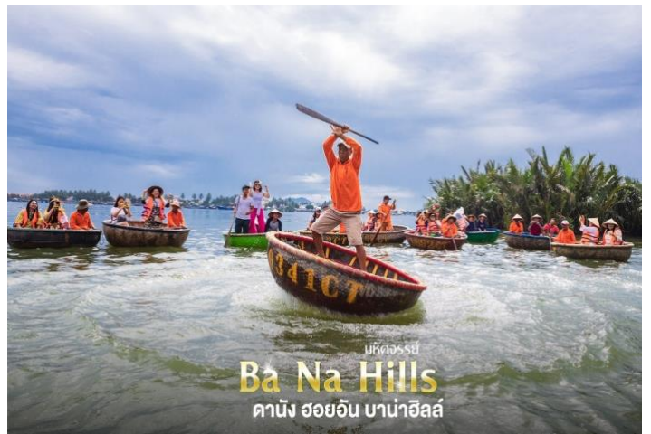
บริษัทจอสซี่ Ba Na Hills คาบัง ฮอยอัน บานาฮิลล์

จากนั้น นำท่านชม ร้านหินอ่อน ให้ท่านเลือกชมและซื้อของฝากเป็นที่ระลึก นำท่านเดินทางสู่ หมู่บ้านกัมทาน สนุกสนานไปกับกิจกรรม!! หนึ่งเรือกระดัง Cam Thanh Water Coconut Village หมู่บ้านเล็กๆ ในเมืองฮอยอันตั้งอยู่ในสวนมะพร้าวริมแม่น้ำ ในอดีตช่วงสงครามที่นี่เป็นที่พักอาศัยของเหล่าทหาร อาชีพหลักของคนที่นี่คืออาชีพประมง ระหว่างการล่องเรือท่านจะได้ชมวัฒนธรรมอันสวยงาม ชาวบ้านจะขับร้องเพลงพื้นเมือง ผู้ชายกับผู้หญิงจะหยอกล้อกันไปมาหน้าที่พายเรือมาเกาะกันเป็นจังหวะดนตรีสุดสนุกสนาน (ไม่รวมค่าทิปคนพายเรือ ท่านละ 40 บาท/ต่อท่าน/ต่อทริป)